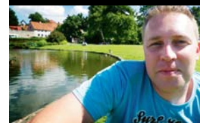
Mattias Karlsson, SD.